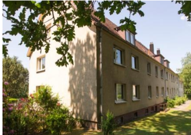
Wedel (Immobilie im Zustand der Bebauung)

Am Rain 2-20, Im Nieland 2a-2c, Tinsdaler Weg 111, 111a, 113, 113a, Galgenberg 70-74 22880 Wedel