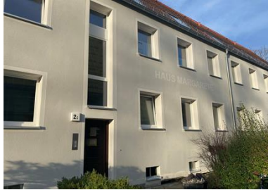
Wedel (Immobilie im Zustand der Bebauung)

Am Rain 2-20, Im Nieland 2a-2c, Tinsdaler Weg 111, 111a, 113, 113a, Galgenberg 70-74 22880 Wedel