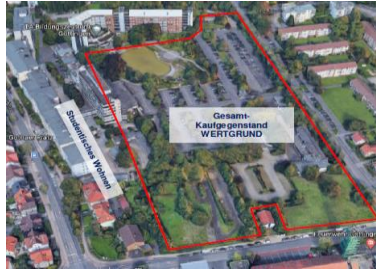
Göttingen (unbebautes Grundstück)

Baujahr: 1954-1955 Sanierung: aktuell in Umsetzung Einheiten: 170 Wohneinheiten 0 Gewerbeeinheiten Gesamtfläche: ca. 10.543 qm Stellplätze: 0 im Fonds seit: Januar 2016 Verkehrswert: 38.440.000 EUR