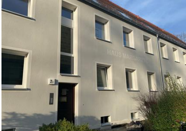
Wedel (Immobilie im Zustand der Bebauung)

Am Rain 2-20, Im Nieland 2a-2c, Tinsdaler Weg 111, 111a, 113, 113a, Galgenberg 70-74 22880 Wedel